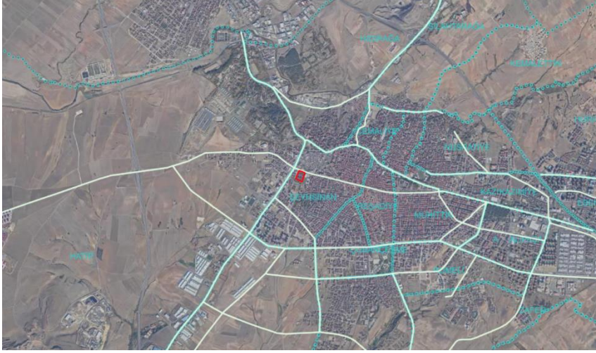
Şekil 1: Planlama Alanının Google Earth Görüntüsü

Şekil 1 de görülen planlama alanları, F19C6C nolu paftada bulunmaktadır.