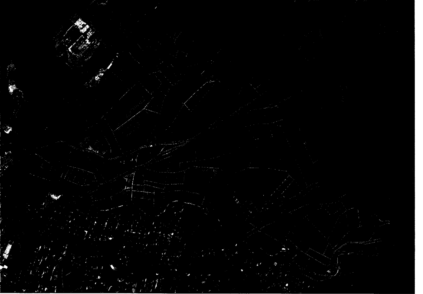
-Uygulama Alanı Genel Görünüm

Parselasyon Planı Açıklama Raporuna konu iş; 'Tekirdağ İli, Çorlu İlçesi, Silah tarağa ve Kemalettin Mahalleleri hudutlarında bulunan Yaklaşık 120 ha Alana İlişkin, 3194 sayılı kanunun 18.maddesinin uygulaması işlemidir.